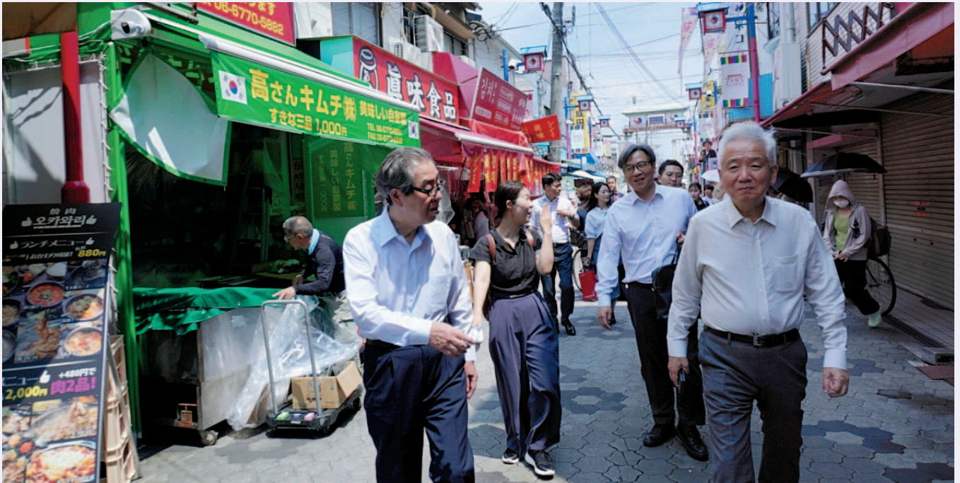
이상덕 청장(오른쪽)이 6일 재일동포들의 역사와 함께한 이쿠노 코리타운을 찾아 동포들의 삶의 현장을 함께하고, 동포들의 눈높이에서 생생한 현장의 목소리도 적극 청취했다.

이에 대해, 재일동포들은 한 목소리로 한일관계 회복을 이뤄낸 윤석열 정부의 노력에 감사와 지지를 보내면서 한일 우호·협력 관계의 지속적인 발전에 재일동포사회가 기여할 차례라고 화답했다.