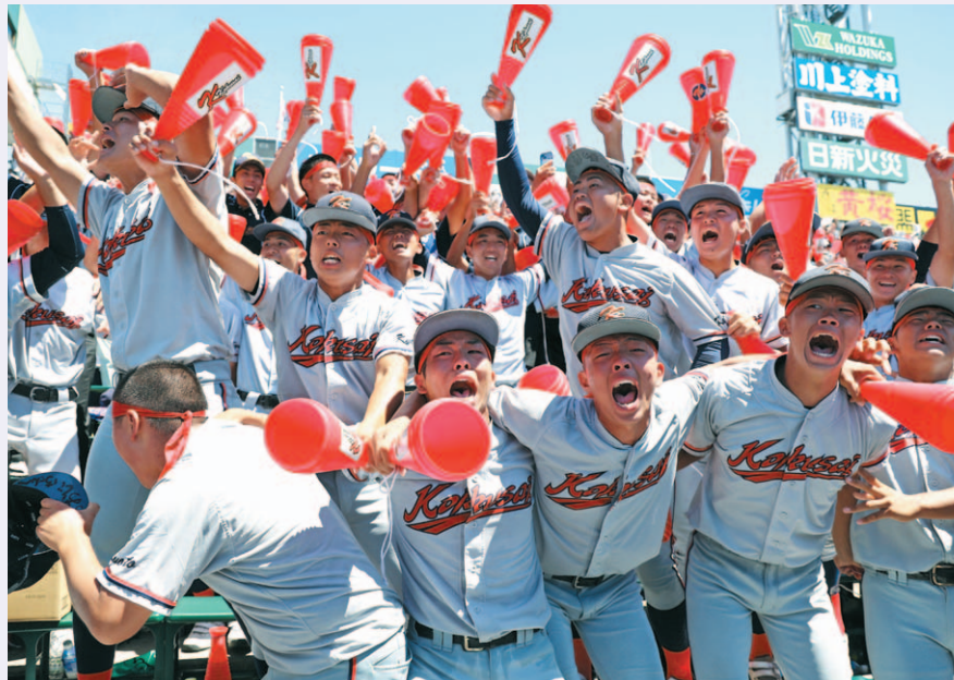
23일 일본 효고현 니시노미야 한신 고시엔구장에서 열린 일본 전국 고교야구선수권대회(고시엔) 결승전 교토국제고와 간토다이이치고 경기. 2-1 승리를 거두고 우승을 차지한 일본 내 한국계 민족학교인 교토국제고 재학생들이 관중석에서 기쁨을 나누고 있다.

서 “대단한 선수들에게 감탄했다”면서 “전원이 강한 마음을 갖고 공격한 결과라고 생각한다”고 말했다.