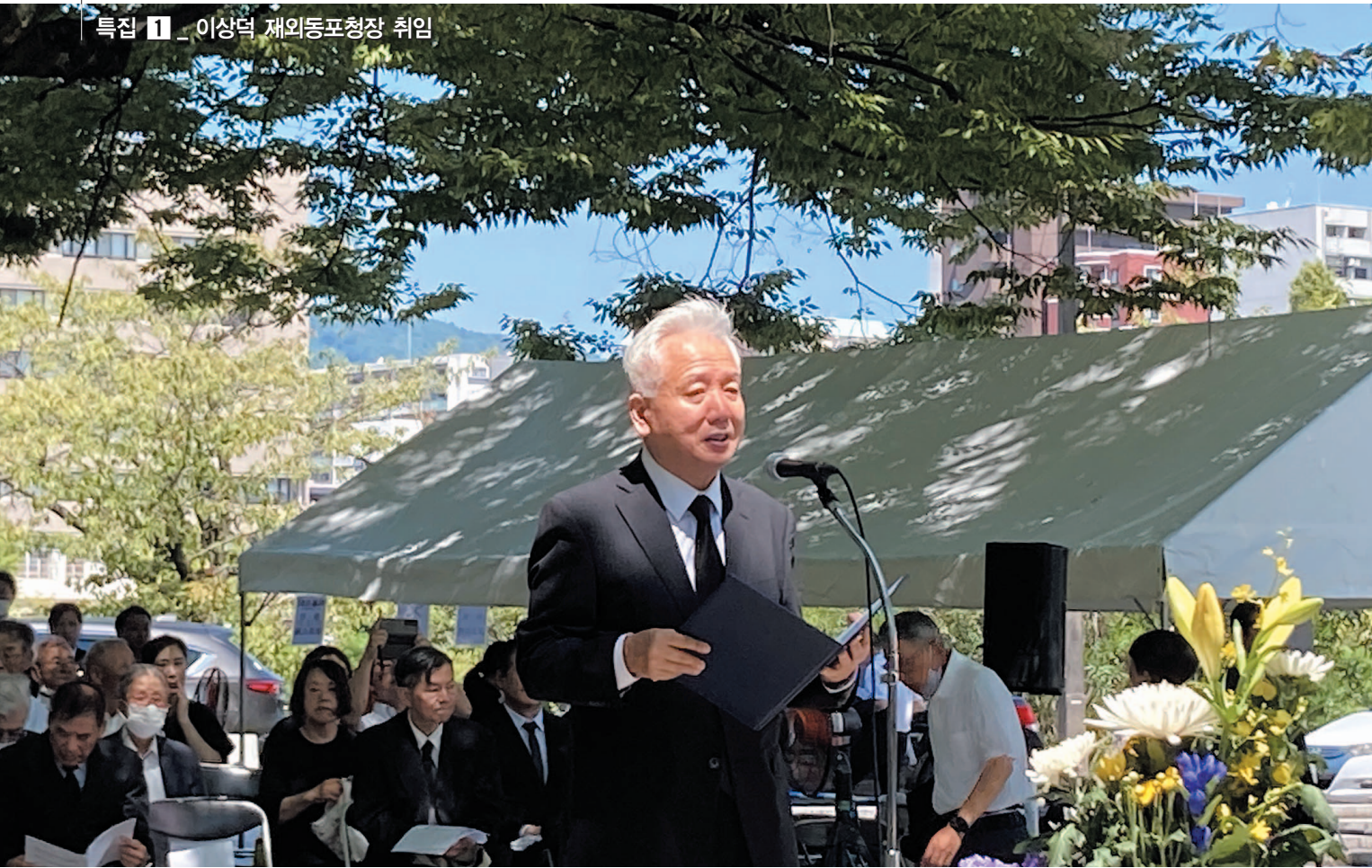
이상덕 재외동포청장이 5일 일본 히로시마 평화기념공원 내 한국인 원폭 희생자 위령비 앞에서 열린 위령제에서 추도사를 하고 있다.