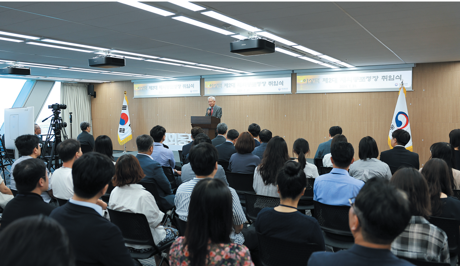
이상덕 청장은 취임사에서 “한민족의 총체적 역량이 확대될 수 있도록 힘쓰겠다”고 강조했다.

이상덕 신임 재외동포청장은 7월 31일 취임식에서 대한민국과 동포사회가 함께 발전할 수 있는 환경을 조성하고, 인류 공동번영과 세계평화 증진에 기여하겠다는 비전을 제시했다. 이를 위해 재외동포 및 국민과의 공감을 토대로 늘 개방하고 소통하겠다고 밝혔다.