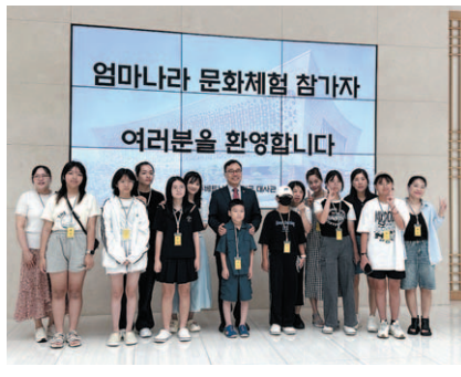
베트남 하노이에서 열린 '엄마나라 문화체험' 참가 한-베트남 다문화가족

그간 하노이 한베가족협회는 베트남에 거주하는 부모가 한국을 찾아 딸과 손주 등을 만나도록 하는 '다문화가족 친정 부모 초청 사업'을 진행해오다가 다문화 2세 자녀 교육도 필요하다고 보고