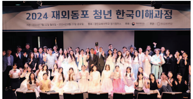
러시아·CIS 고려인 청년들 ‘한국이해과정’ 수료식 모습.

행사 공동 주최 측인 경인교대는 참가자들을 위해 한국어와 한국 역사 교육과 국악 및 태권도, 한국 요리, K-팝 등을 체험하는 프로그램을 마련했다. 또 재외동포청을 비롯해 한국문화예술위원회, MBC, 한국민속촌, 서울의 고궁 등 방문과 한국의 발전된 산업 현장 견학도 진행했다. 참가자들은 수료식 후 2박 3일 일정으로 강원도를 방문해 동해와 비무장지대(DMZ)를 둘러보고, 23일