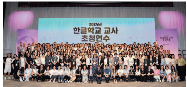
7월 22일 인천 송도컨벤시아에서 열린 '2024년 한글학교 교사 초청연수' 개막식이 끝난 후 참가교사들이 단체 기념사진을 찍고 있다.