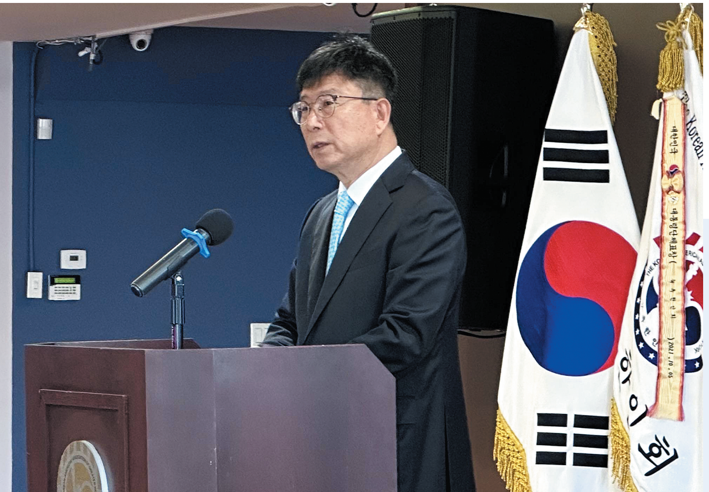
김익환 주뉴욕 총영사가 지난 15일(현지시간) 오전 미국 뉴욕 맨해튼 뉴욕한인회관에서 주뉴욕총영사관, 광복회 뉴욕지회, 민주평화통일자문회의 뉴욕협의회 공동 주최로 열린 '제79주년 광복절 경축식'에서 경축사를 하고 있다.