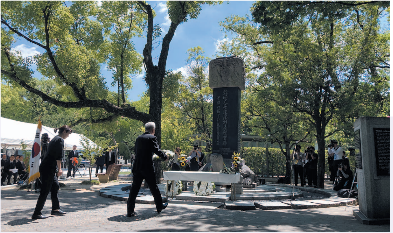
이상덕 재외동포청장이 5일 일본 히로시마 평화기념공원에서 열린 한국인 원폭 희생자 위령제에서 헌화를 하고 있다.