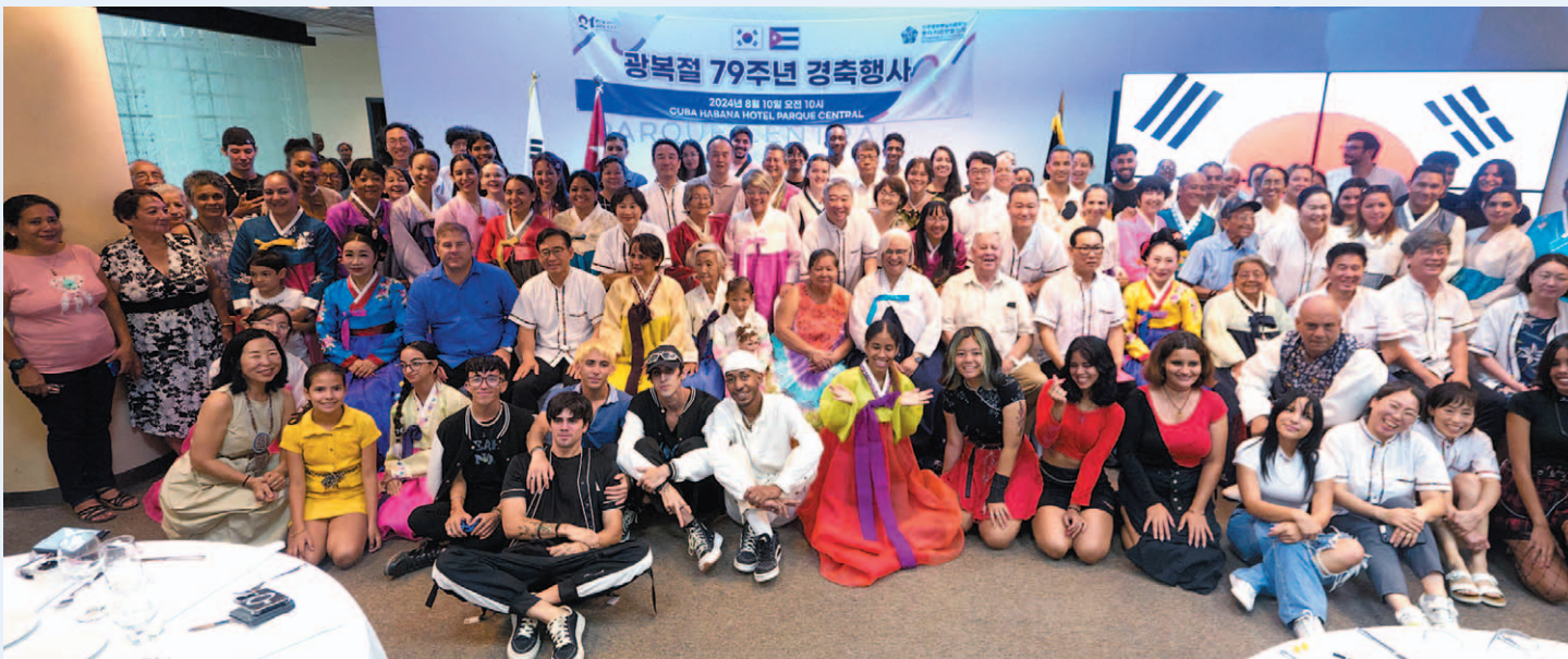
지난 10일(현지시간) 쿠바 아바나 한 호텔에서 열린 민주평화통일자문회의 중미·카리브협의회 주관 79주년 광복절 행사에서 참석자들이 기념 촬영하고 있다.

대사관 측은 "특히 내년(2025년)은 한인 이민 120주년이 되는 해로서 이를 기념하기 위한 행사 추진을 위해 재외동포청, 국가보훈부 등 유관기관과 협력할 예정"이라고 밝혔다. [장]