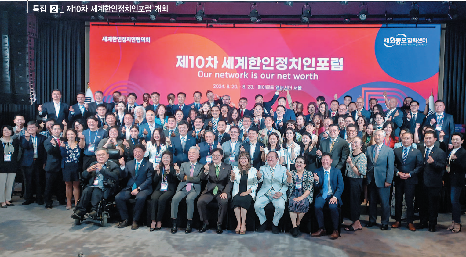
20일 서울 여의도 페어몬트 엠베서더 서울에서 14개국 100여명의 한인 정치인이 참가한 '제10차 세계한인정치인포럼'이 개막식 후 참가자들이 기념사진을 찍고 있다.