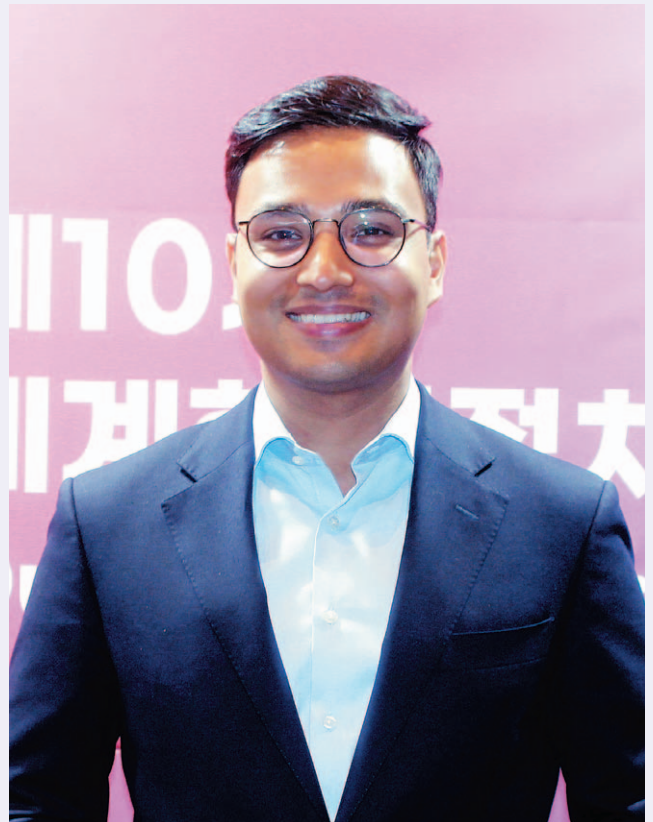
야닉 슈티 오스트리아 연방 하원의원은 지난 21일 서울 여의도 페어몬트 앰배서더 서울에서 기자와 만나 “초심을 잊지 않고 더욱 겸손한 자세로 저를 뽑아 준 유권자들에게 보답하겠다”고 강조했다.

그는 오는 9월 총선에서도 연금 개혁 등을 공약으로 변화를 주도하는 선거 전략을 펼칠 계획이라고 밝혔다. 슈티 의원은 “이번 한인정치인포럼을 통해 공통된 스토리를 가진 세계 각국의 한인 정치인들로부터 성과를 공유할 수 있어 기대가 크며 흥분된다”면