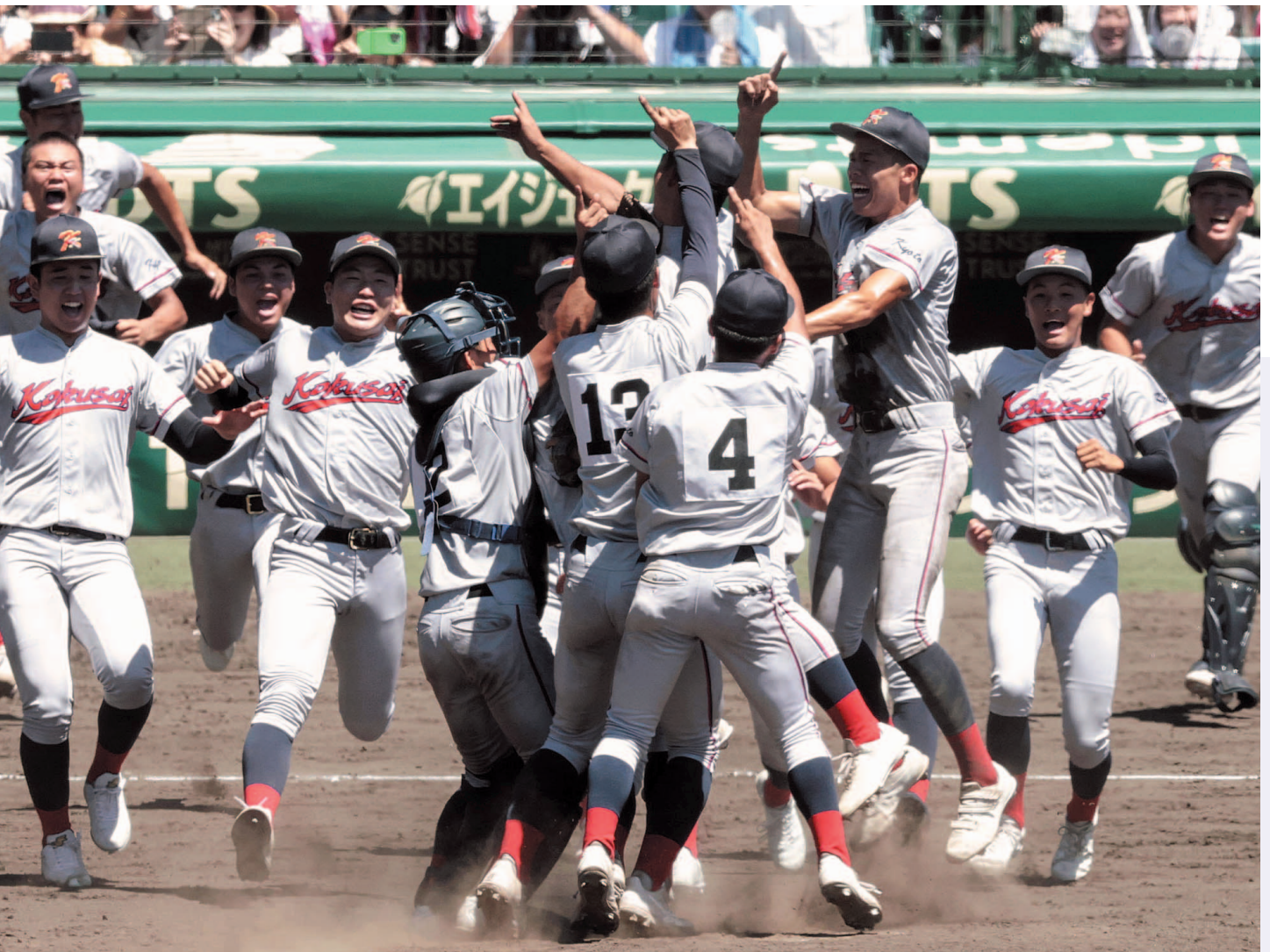
23일 일본 효고현 니시노미야 한신고시엔구장에서 열린 전국 고교야구선수권대회(여름 고시엔) 결승전에서 2-1 승리를 거둔 뒤 한국계 국제학교인 교토국제고 선수들이 마운드로 몰려나오고 있다

교토국제고는 앞서 2021년 처음 여름 고시엔 본선에 진출해 4강에 올랐으나 결승 진출에 실패했다. 2022년 여름 고시엔에도 본선에 나갔으나 1차전에서 석패했고, 지난해는 본선에 진출하지 못했다.