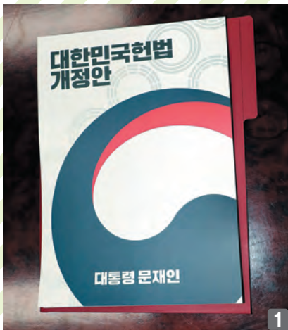
1. 3월 26일 한병도 청와대 정무수석이 국회에 제출한 정부 개헌안(대한민국헌법 개정안) 표지 모습. 2. 아랍에미리트(UAE)를 공식 방문 중이던 문 대통령은 바라카 원전 1호기 완공식에 참석하기에 앞서 개헌안의 국회 송부와 공고를 전자결재로 재가했다. 정부는 이에 앞서 이날 오전 10시 이낙연 국무총리 주재로 국무회의를 열어 전문(前文)과 11개 장 137조 및 부칙으로 구성된 대통령 개헌안을 의결했다.