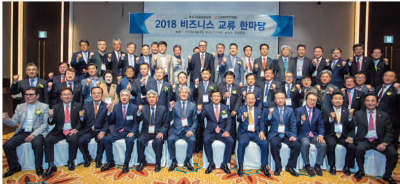
4월 8일 오후 제주도 서귀포시 부영호텔 우정홀에서 열린 세계한인무역협회(월드옥타)와 중소기업융합중앙회의 해외 협력 양해각서(MOU) 체결식에서 참석자들이 기념촬영을 하고 있다.