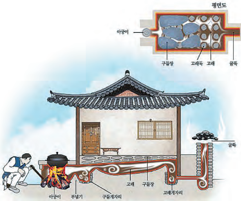
온돌의 구조와 원리

온돌문화는 청동기 시대를 거쳐 원삼국 시대(기원전 1세기~기원후 4세기) 부뚜막식 화덕과 연도(연기가 빠져나가는 통로)가 설치된 원시적 형태의 난방 방식에서 기원했다. 한반도 전역에서 기원전 3세기~1세기 것으로 보이는 원시적 온돌 유적들이 발견된 만큼 온돌문화는 2천 년 이상 된 것으로 추정된다. 온돌은 서양 벽난로와 달리 연기를 굴뚝으로 바로 내보내지 않고, 불을 놓혀 기어가게 만들어 불 윗부분을 깔고 앉는 바닥 난방이 특징이다. 공간 내부에 연기를 발생시키지 않으면서도 오랫동안 따뜻함을 유지할 수 있는 장점이 있다.