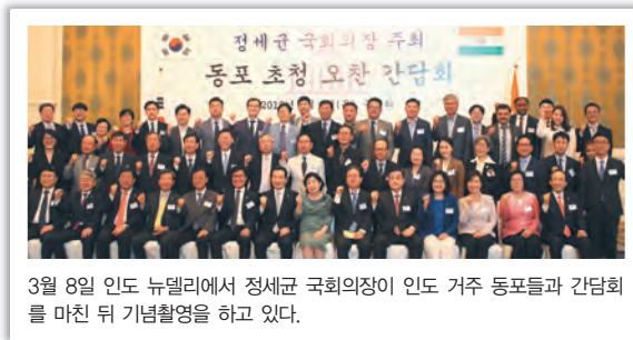
3월 8일 인도 뉴델리에서 정세균 국회의장이 인도 거주 동포들과 간담회를 마친 뒤 기념촬영을 하고 있다.

재인도 한인동포들은 3월 8일 뉴델리를 방문한 정세균 국회의장과 가진 동포간담회에서 인도와 한국의 교류에 정부와 국회의 지속적 관심을 요청하고 비자 발급 어려움 등 애로를 호소했다. 구상수 재인도한인회장은 교민 자녀들을 대상으로 한 한글학교 교육과 인도 대학교의