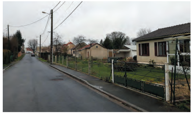
100년 전 프랑스 전후복구 참여 한인들이 거주했던 쉬프 지역의 현 주택가의 모습. 당시 주택 몇 채가 현재까지 남아있다고 한다.