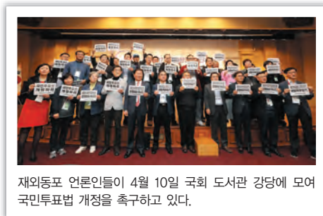
재외동포 언론인들이 4월 10일 국회 도서관 강당에 모여 국민투표법 개정을 촉구하고 있다.