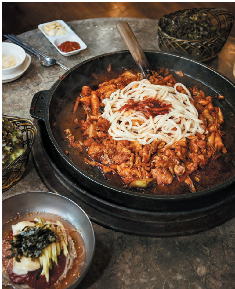
춘천 여행의 마침표, 막국수와 닭갈비.

춘천이 닭갈비와 특별한 인연을 맺은 계기는 무엇이였을까? 춘천시청은 그 연원을 1960년 무렵으로 보고 있다. 막걸리 안주용으로 돼지불고기를 팔던 한 선술집 주인이 돼지고기를 구하기 어려워지자 대신 닭고기에 돼지불고기의 양념을 넣은 다음 12시간을 재웠더니 그 맛이 그만이었다. 주로 가스 불판에 닭고기를 굽는 지금과 달리 그 당시에는 숯불 화로 석쇠나 드럼통 연탄불에 닭고기와 썬 고구마 등을 얹어 요리했다.