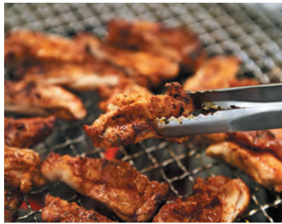
가스 불판에서 익혀지는 닭갈비(왼쪽)와 숯불 석쇠에서 구워지는 닭갈비(오른쪽).

방송에 소개되자 그 명성이 하루가 다르게 급격히 높아졌다. 특히 2000년대 들어 한류 열풍이 불러일으킨 KBS TV 드라마 '겨울연가'는 닭갈비의 국제화에 결정적 역할을 했다. 이 지역을 무대로 제작된 '겨울연가'가 인기리에 방영되면서 닭갈비 음식도 덩달아 해외에까지 널리 알려지게 된 것. 근래 들어 일본, 중국, 대만 등 외국 여행객들이 닭갈비 맛을 보러 이곳에 찾아오는 이유다.