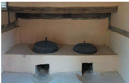
온돌문화는 원시적 형태의 난방 방식에서 기원했다. 문화재청은 온돌문화를 국가무형문화재로 지정 예고했다. 사진은 충남 예산에 있는 추사(秋史) 김정희 선생 고택의 아궁이.

중국에서 온돌문화를 알리는 ‘전도사’ 역할을 해온 김준봉 베이징공업대학 교수는 “지구에서 가장 친환경적이며 인체에 유익하고 청결한 난방 방식이 바로 온돌”이라면서 “온돌이 문화적으로 독창성과 우수성, 대중성을 모두 갖췄다는 점에서 유네스코의 인류무형문화유산으로 등재될 가능성이 충분하다”고 강조했다. 한편 우리 정부는 온돌문화를 국가무형문화재로 지정 예고했다고 3월 16일 밝혔다. 문화재청은 “온돌은 혹한의 환경에 적응하고 대처해온 한국인의 창의성이 발현된 문화로, 고유한 주거기술을 보여준다는 점에서 국가무형문화재로서 가치가 높은 것으로 평가받았다”고 설명했다. [참]