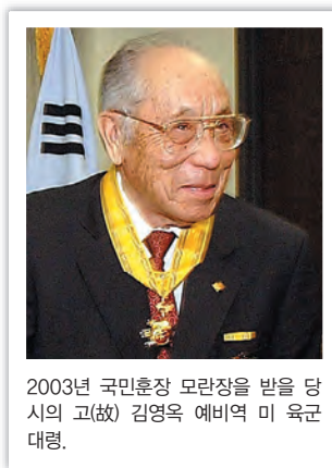
2003년 국민훈장 모란장을 받을 당시의 고(故) 김영옥 예비역 미 육군 대령.