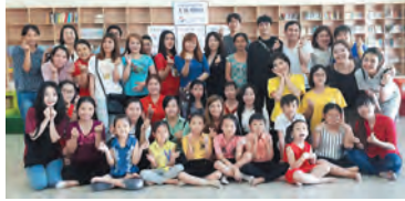
재외동포재단은 3월 10일 베트남 컨터시 소재 '한-베 함께 돌봄센터'에서 한-베 다문화 취약 가정 자녀를 위한 도서 기증식을 열었다.

재외동포재단은 3월 10일 베트남에 거주하는 한-베 다문화 취약 가정 아동들을 위해 한국 도서 1천500여 권과 전통문화용품을 기증했다.