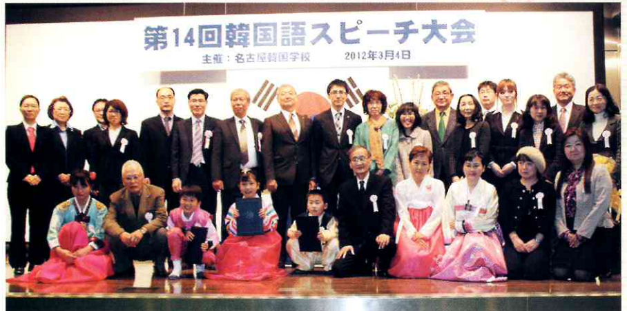
2012년 3월 4일 나고야 한국학교에서 열린 '제14회 한국어 말하기 대회'에 참가한 수상자들과 학교 관계자들이 기념촬영을 하고 있다.