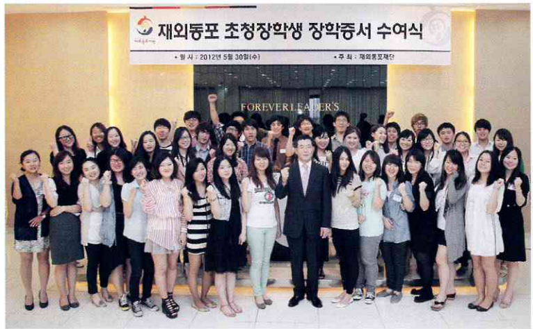
재외동포재단은 5월 30일 서울 서초동 외교센터 12층에 위치한 포에버리더스클럽에서 재외동포재단 초청 장학생 증서 수여식을 개최하였다.

이바지 할 인재 육성을 위하여 1997년부터 우수 재외동포 학생을 초청하여 국내 대학원에서 이수기회를 제공하는 석·박사과정 재외동포 초청 장학사업을 시행해 왔으며 2009년부터 학사과정을 새로이 개설하였다.