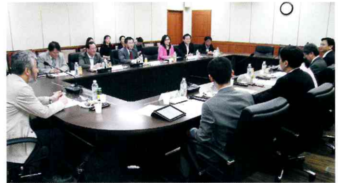
재외동포재단은 재단 교육 사업에 참여하였던 한국어 교육 정책 관련 전문가를 대상으로 5월 25일 재단 회의실에서 간담회를 개최하였다.