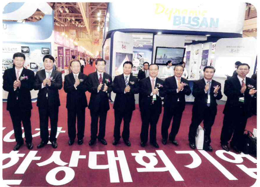
오는 10월 16일~18일 서울에서 열리는 ‘제11차 세계한상대회’는 네트워크 활성화를 꾀하고 내실 있는 대회운영을 통해 한상의 긍정적 이미지를 세우는 자리가 될 전망이다.

동포재단은 최근 한상대회 10주년 종합 평가를 통해 향후 발전 방향등을 모색해왔다. 이번 서울대회에는 그런 결과를 반영해 더욱 알차고 내실 있게 꾸며질 예정이다. 재단 관계자는 “모국에 보탬이 되는 한상, 한민족의 미래를 논하는 한상으로 대회를 치를 예정”이라고 말했다.