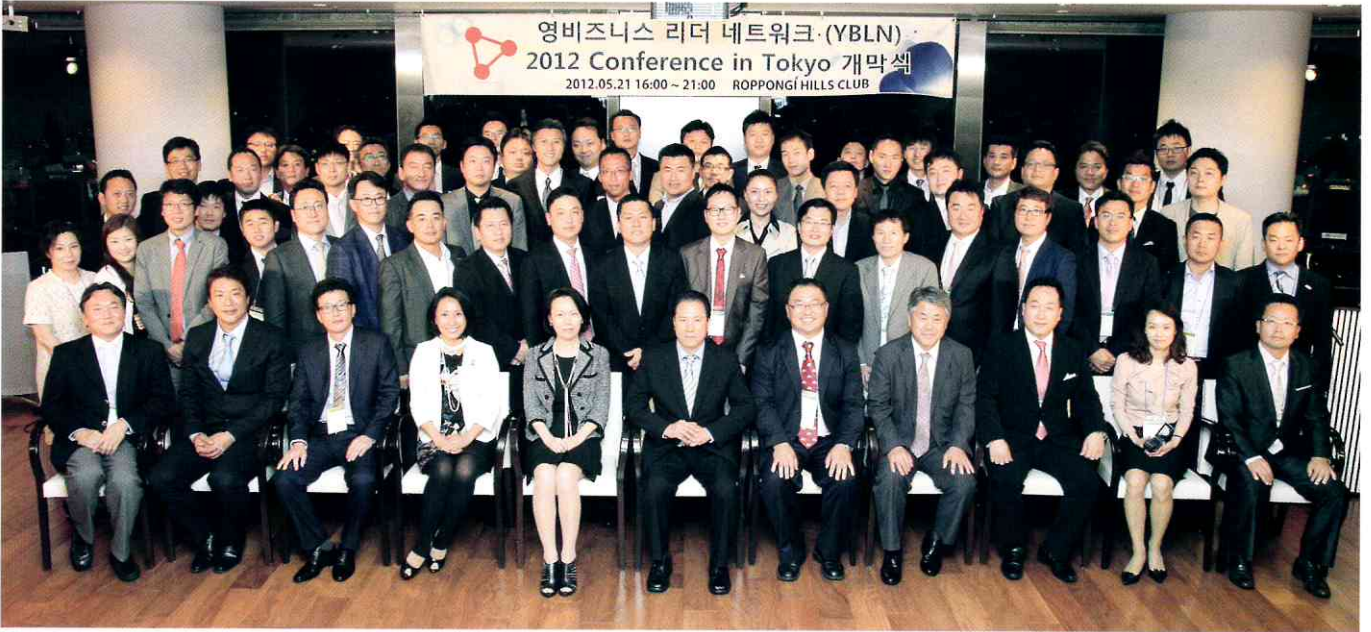
전 세계 젊은 동포 기업인들의 비즈니스 한마당인 '제3회 영비즈니스리더네트워크(YBLN) 컨퍼런스'가 5월 21일부터 23일까지 일본 동경에서 열렸다.