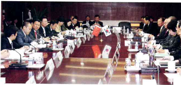
한·중 양국은 5월 2일 베이징 시내 상무부 청사에서 박태호 통상교섭본부장과 천더밍(陳德銘) 상무부장을 수석대표로 회담을 열었다. 왼쪽 세번째 인물이 천 상무부장.

한·중 FTA가 체결되면 우리나라는 세계 3대 경제권과 FTA를 맺은 세계 유일의 나라가 되며 우리의 경제 영토는 70%로 늘어날 전망이다. FTA를 중심으로 재편되고 있는 국제 통상환경에서 중심적인 위치를 차지하는 ‘FTA 허브국가’가 된다는 의미에서 주목 받고 있다.