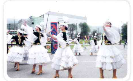
고려인과 한인 1천여 명이 참석한 한민족 축제에서 고려극장 무용단이 카자흐 전통춤을 추고 있다.