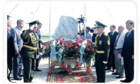
5월 28일 고려인 최초 정착지인 카자흐스탄 우수토베에서 고려인 정주 75주년 기념 감사비 제막행사가 열렸다.