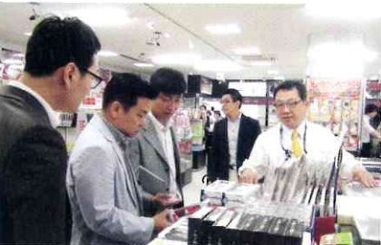
대회에 참가한 한상들은 제일동포 한상업체인 (주)에이산을 방문해 비즈니스에 대해 설명을 듣고 있다.

100년이 넘는 이민 역사로 인해 재외동포들도 3세, 4세를 넘어서고 있으며, 세대가 내려갈수록 점차 모국과의 연결고리가 희박해지고 있는 상황이다. 이런 점에서 차세대 젊은 한상들이 더욱 발굴되고, 한상대회를 통해 세계 각지의 한상들과 만남으로 자신들의 정체성을 확립해가고 교류를 확대해 나가는데 재외동포재단은 주력해오고 있다.