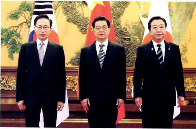
이명박 대통령과 후진타오(胡錦濤) 중국 국가주석, 노다 요시히코(野田佳彦) 일본 총리가 5월 14일 중국 베이징(北京) 인민대회당에서 열린 한·중·일 정상회담에서 기념촬영하고 있다.

이 명박 대통령은 5월 13~14일 중국 베이징에서 열린 ‘제5차 한·중·일 정상회의’에 참석해 연내 3국 간 자유무역협정(FTA) 협상을 개시하기로 합의하고, 경제 분야에서는 최초로 ‘투자보장협정’을 체결했다.