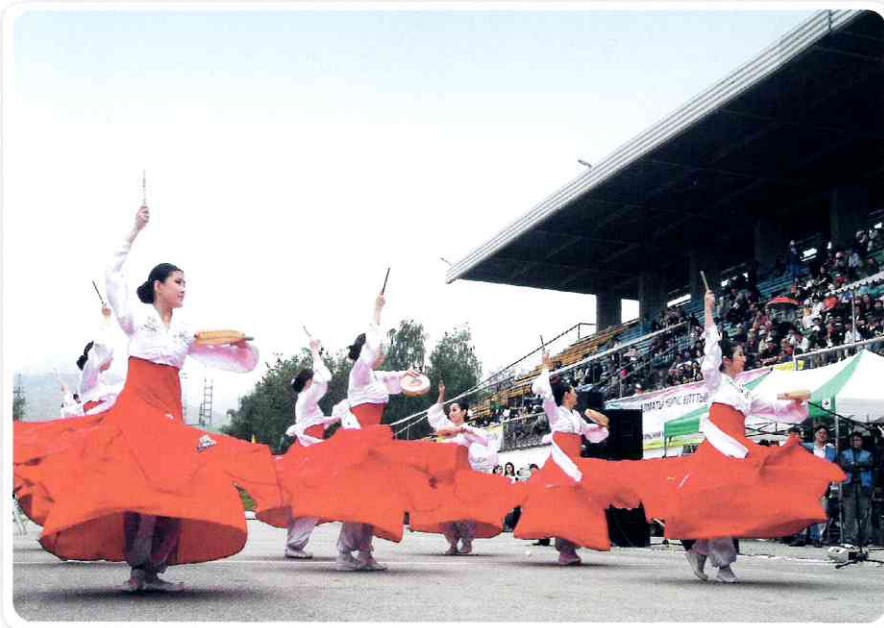
한국·카자흐스탄 수교 20주년 및 고려인 이주 75주년을 기념하는 한민족 축제가 5월 12일 알마티 카주구 대학교에서 열렸다. 고려극장 무용단이 소고춤을 추고 있다.