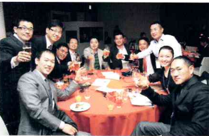
세계 각국에서 활약하는 젊은 한상들의 네트워크 구축을 위한 이번 대회에서는 20여 개국에서 100여명이 참석했다.