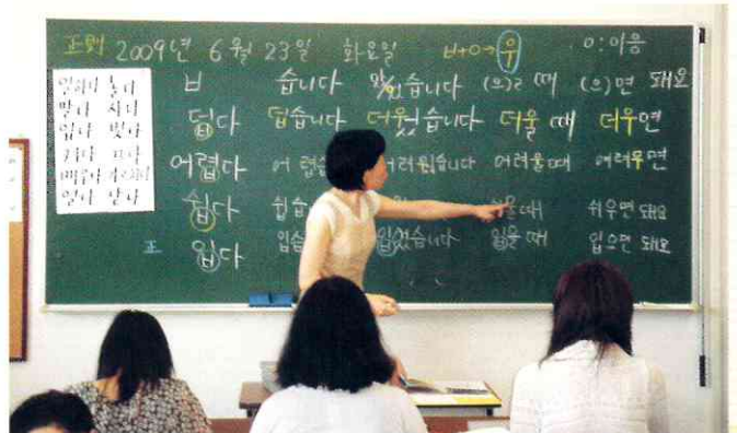
현재 학교에는 25명의 교사가 초등부 67명과 성인반 500명을 가르치고 있다.

려고 다양한 프로그램을 펼치고 있는데 6월 16일에는 안도현 시인의 문학강연회를 열 예정이다.