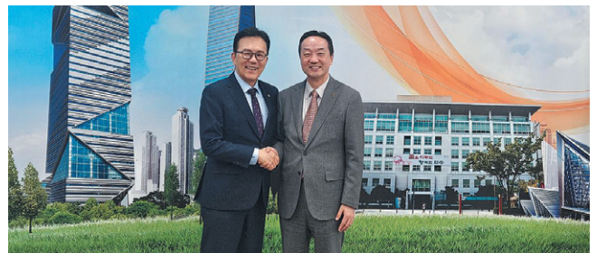
변철환 재외동포청 차장(오른쪽)은 지난 7일 인천광역시 연수구청을 찾아 이재호 구청장과 국내 귀환동포 지원을 위한 협력 방안을 논의했다.

움터 등을 설립해 운영하는 등 적극적인 노력을 전개하는 만큼 상호 협력을 확대하기를 바란다”면서 “동포청은 한국 사회의 미래 자원으로 자라날 청소년의 교육환경 개선에 주안점을 두고 있다고 강조했다.