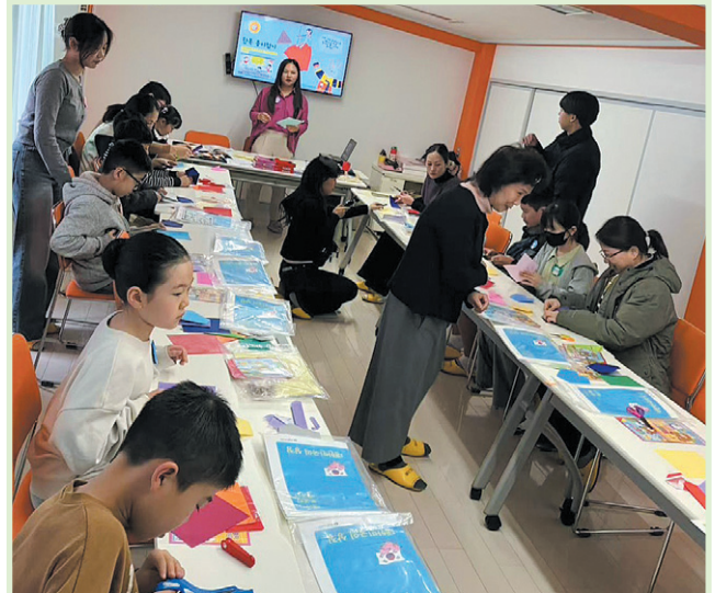
16일 도교 샘물학교에서 열린 종이접기 수업. 종이문화재단(이사장 노영혜)이 제공한 종이접기 교재와 재료들을 이용해 수업이 진행됐다.