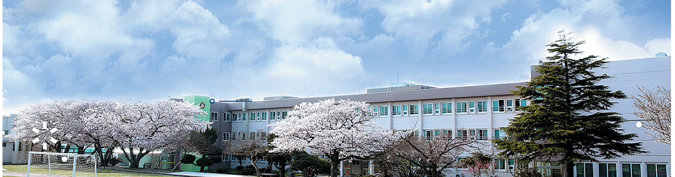
김평진 회장이 1966년 폐교 위기에 처해있던 학교법인 제주여자학원을 인수해 이사장으로 취임해 정상화 시킨 제주 여자중고등학교 전경.

세계적인 제주인으로, 개인의 성공만이 아니라 제주도의 발전을 위해 전 생애를 바친 김 회장은 80세를 일기로 지난 2007년 3월 29일 별세했다. [창]