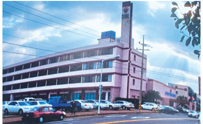
행정안전부 국가기록원이 공개한 1963년 제주도관광호텔 개장식 모습(위). 제주관광호텔

을 남긴 김 회장은 1963년 대한민국 문화훈장, 1981년 대한민국 국민훈장 모란장, 1987년 국민훈장 무궁화장을 수훈했다. 1998년에는 제주대학교에서 명예 경영학박사 학위를 받기도 했다.