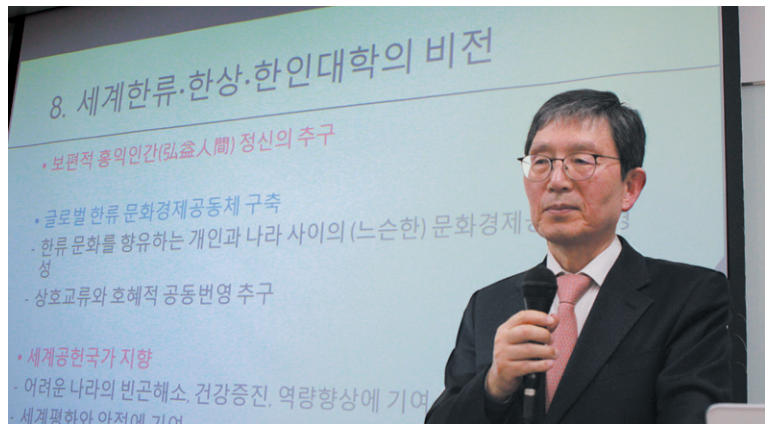
지난 10일 서울 중구 장충동 종이문화재단에서 지구촌 한글학교 미래 포럼 주최로 열린 제7회 발표회에서 성경룡 상지대 총장이 기조강연을 하고 있다.

로그램인 글로벌 한류 연합대학을 설립한다는 계획이다. 에라스무스 프로그램(ERASMUS·European Region Action Scheme for the Mobility of University Students)은 유럽 연합에 속한 나라들 사이의 교환학생 프로그램이다. 2013년 기준으로 27만여 명의 학생들이 참가했다. 현재 30개 이상의 국가에서 4000개 이상의 대학들이 에라스무스 프로그램에 참여하고 있다.