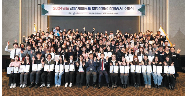
사진은 지난해 선발 장학생을 대상으로 한 장학증서 수여식

협력센터는 올해에만 3월 학기 입학자도 신청이 가능하게 했다. 장학생이 되면 지난해 대비 16% 인상된 연간 생활지원금 1천320만원을 비롯해 최초 입·귀국 항공료, 논문 인쇄비, 보험료 등을 지급하며, 한국어 능력이 부족한 학생에게는 진학 전 한국어 연수 과정도 지원한다. 또 역대 장학생 선후배들과의 교류와 대한민국