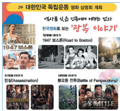
대한민국 독립운동 영화 상영회 포스터

이달 샌프란시스코·베이 지역 한인회관에서 상영되는 영화는 '1947 보스턴'이다. 광복 이후 최초로 1947년 보스턴 마라톤 대회에 참가한 서윤복과 그의 코치이자 전설적 마라토너 손기정의 이야기를 그렸다. 이후