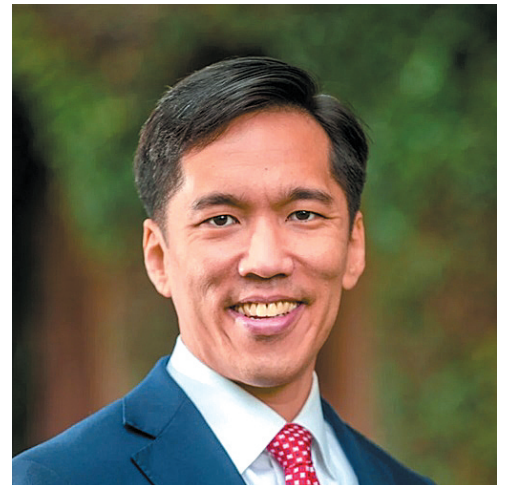
김병수 서던캘리포니아대(USC) 부총장

그는 “K팝과 K드라마를 비롯해 한국이 창의 자본을 갖고 이를 세계에 수출하는 것이 자랑스럽다”면서 “나는 옛날 사람이라서 K