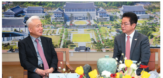
이상덕(왼쪽) 재외동포청장이 경북도청을 방문해 이철우 지사와 대담을 나누고 있다.

그러면서 “동포청에서 실시하는 주요 정책과 사업들이 동포들의 생활에 실질적으로 체감이 되고 도움이 될 수 있도록 더욱 노력하겠다”고 강조했다.