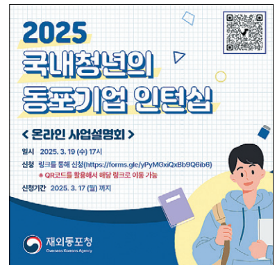
2025년도 국내청년의 동포기업 인턴십 인턴 모집 공고문

한상넷 홈페이지를 통해 신청하면 된다. 지원서 작성 후 제출 버튼을 클릭해야 제출이 완료되며, 1인당 1개 기업만 지원이 가능하다.