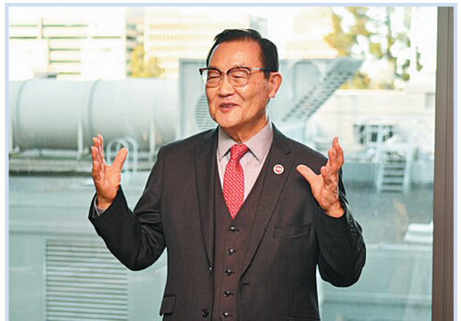
최석호 미국 캘리포니아주 상원의원

미주 안에서 한인이 가장 많이 사는 캘리포니아 주에서 주의회에 진출한 한인 출신은 제가 유일할 뿐만 아니라 아시아인으로도 유일합니다. 캘리포니아주 역사상 최고령으로 당선된 기록도 갱신