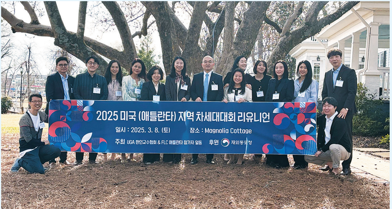
지난 8일 미국 조지아주 애틀랜타에서 열린 세계한인차세대대회(FLC) 첫 지역 차세대대회에서 참가자들이 기념사진을 찍고 있다.

애틀랜타서 네트워크 성사...지역별 차세대대회 통해 글로벌 차세대 소통 강화