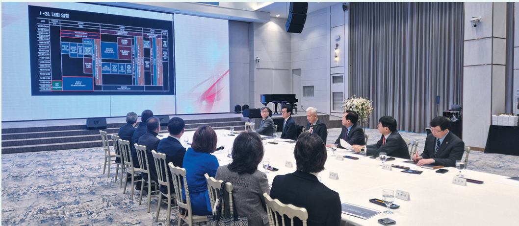
지난 4일 서울 마포구 중소기업중앙회 DMC 타워에서 열린 제23차 세계한인비즈니스대회 주최·주관 기관장 합동점검 회의에서 이상덕 (오른쪽에서 4번째) 재외동포청장이 인사말을 하고 있다.

미 국 애틀랜타에서 열리는 제23차 세계한인비즈니스대회를 한달여 앞둔 4일 재외동포청은 중소기업중앙회, 미주한인상공회의소총연합회, 매일경제신문과 함께한 점검회의에서 “차질 없이 준비되고 있다”고 밝혔다.