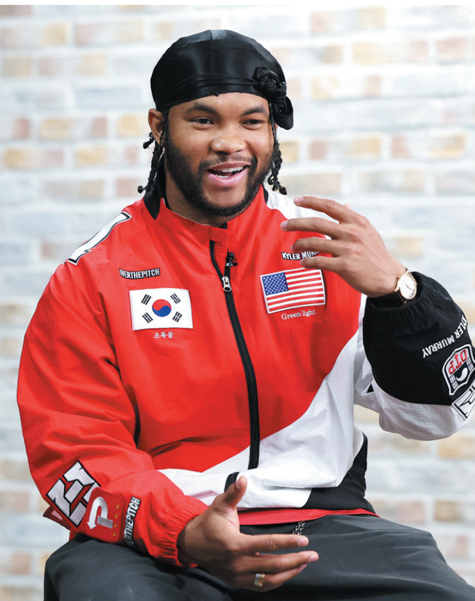
태어나서 처음으로 한국을 찾은 미국프로풋볼(NFL) 한국계 스타 쿼터백 카일 머리가 11일 서울 종로구 연합뉴스 본사에서 연합뉴스·연합뉴스TV와 인터뷰를 하고 있다.