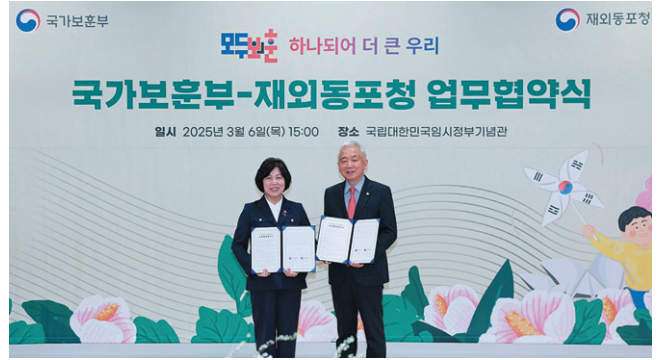
이상덕 재외동포청장(오른쪽)과 강정애 국가보훈부 장관이 MOU를 체결한 뒤 기념사진을 찍고 있다.

이상덕 청장은 “재외동포청 출범 이후 대한민국과 재외동포의 동반성장 정책을 추진해 오고 있으며, 양 기관의 협력으로 이제 보훈분야까지 대한민국과 재외동포 간 상생할 수 있는 기반을 마련하게 됐다”고 의미를 부여했다.