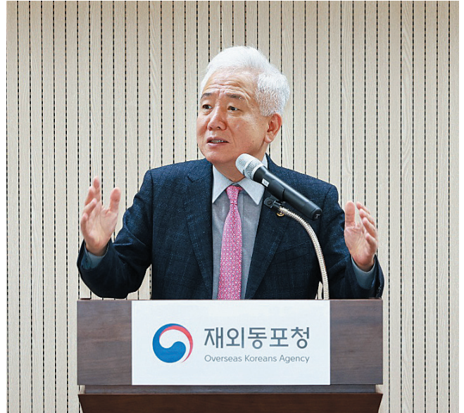
이상덕 재외동포청장이 지난 2월 11일 인천 송도 소재 재외동포웰컴센터에서 열린 신년 브리핑에서 재외동포들의 모국 기여 사례를 발굴해 2025년부터 ‘이달의 재외동포’를 신설하겠다고 밝히고 있다.

이외에도 재외동포청은 재외동포에 대한 국민들의 인식 제고를 위해 ‘재외동포에 대한 내국인 인식조사’를 비롯해 재외동포의 개