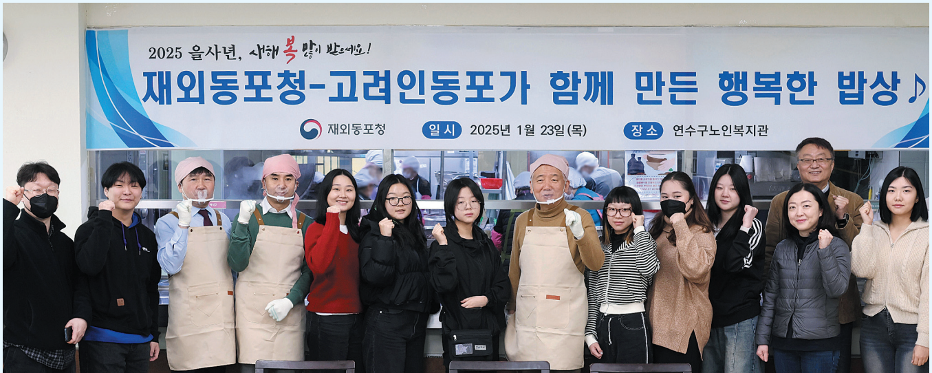
23일 오전 인천시 연수구 소재 연수구노인복지관에서 이상덕(왼쪽서 8번째) 재외동포청장이 고려인 동포들과 함께 지역 어르신들을 위한 설맞이 봉사활동에 앞서 화이팅을 외치고 있다.

재외동포청(청장 이상덕)은 23일 오전 인천시 연수구 소재 연수구노인복지관에서 고려인 동포들과 함께 지역 어르신들을 위한 설맞이 봉사활동을 펼쳤다.