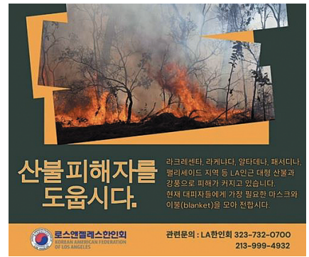
LA한인회, LA 산불 피해자 지원 위한 구호품 모집 안내

재외동포청은 “희생되신 분들의 명복을 빌며 유가족들께 깊은 위로를 드린다”며 “정부는 모든 자원을 총동원해 피해 수습과 지원에 총력을 다하고 있다”고 밝혔다.