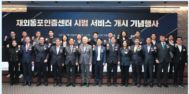
지난해 11월 28일 서울 서초구 외교타운에서 열린 재외동포인증센터 시범 서비스 개시 기념행사에서 이상덕(앞줄 6번째) 재외동포청장을 비롯해 주요 참석자들이 파이팅을 외치고 있다.

이같은 성과를 바탕으로 새해에는 ▲국내 동포를 위한 종합적·실질적 지원 지속 ▲민생 경제에 기여하는 동포 정책 추진 ▲재외동포 정체성 함양과 글로벌 한인 네트워크 강화를 위한 지