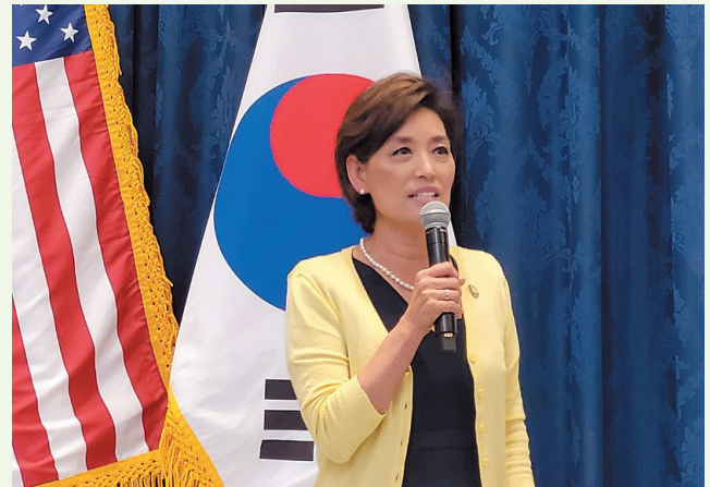
영 김 미국 연방 하원의원

그는 “미국이 이 지역에서 인권을 증진하고 자유를 사랑하는 국가들을 지지하고 동맹국과의 자유 무역을 강화하는 한편 적들에게 책임을 묻는 것을 선도할 수 있도록 초당적으로 일할 것”이라고 말했다. 동아태 소위는 동아태국을 비롯한 국무부의 동아태