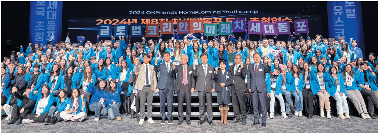
재외동포청이 주최하고 재외동포협력센터가 주관한 '제8차 차세대동포 모국 초청연수' 개최식이 15일 서울대 시흥캠퍼스에서 진행됐다.

재 외동포청(청장 이상덕)은 전 세계 31개국에 거주하는 차세대 동포 441명을 한국으로 초청, 한국을 배우고 체험할 기회를 제공하는 모국연수를 시행했다.