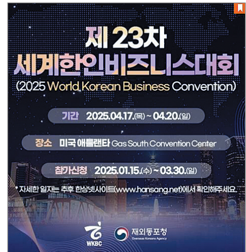
사진은 제23차 세계한인비즈니스대회 안내문

재외동포청은 올해 대회를 통해 재외동포 경제인과 국내 기업인의 지역별·분야별 연계를 강화해 글로벌 경제 위기에 능동적으로 대응하고, 수출 진흥을 적극 추진한다는 목표를 세웠다.