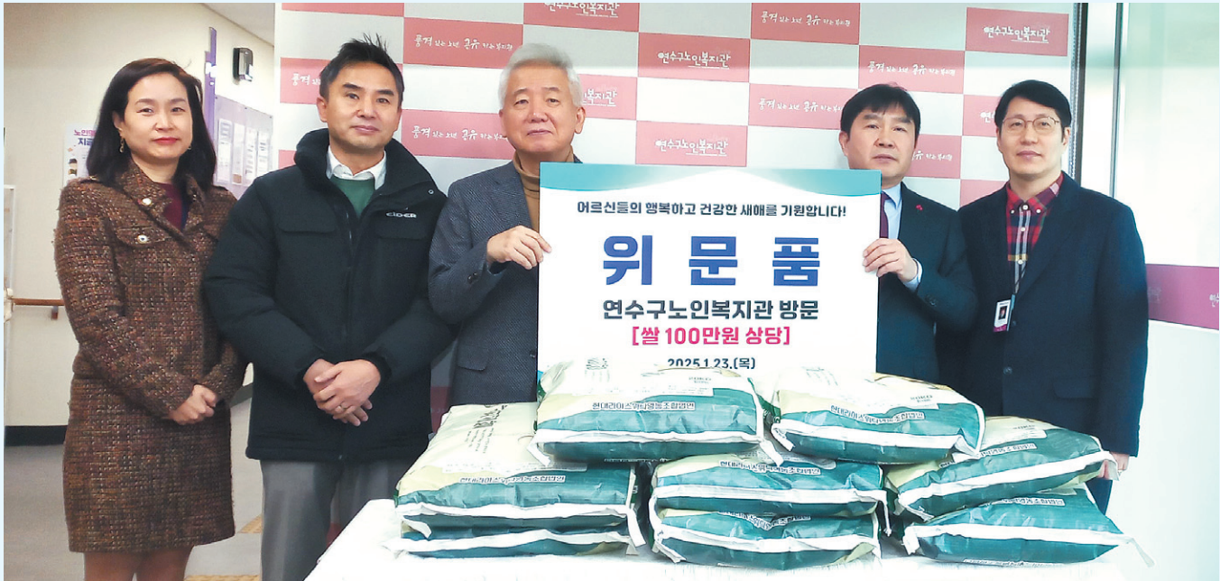
23일 오전 인천시 연수구에 소재한 연수구노인복지관에서 이상덕(왼쪽서 3번째) 재외동포청장이 최호영(왼쪽서 4번째) 노인복지관장에게 위문품을 전달하고 있다.