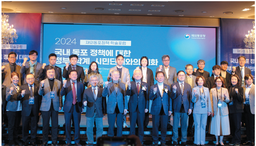
지난 12월 6일 서울 여의도 CCMM빌딩에서 열린 국내 체류 동포 정책 학술 포럼에서 참석자들이 기념촬영을 하고 있다.

이밖에 동포청은 국내 체류 동포 지원 차원에서 2월 7일까지 민간 단체 지원을 위한 '2025년 국내 체류 동포 관련 단체 지원사