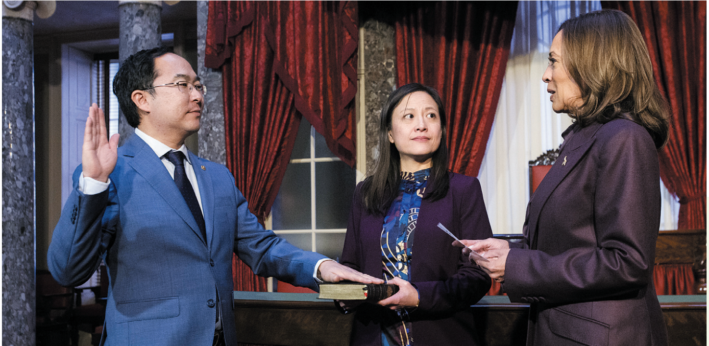
앤디 김(왼쪽) 미 연방 상원의원이 지난 3일 워싱턴 DC의 의회 의사당 내 옛 상원회의장에서 상원 의장을 겸직하는 카멀라 해리스 부통령 앞에서 취임 선서를 하고 있다.

그는 또 “인도·태평양지역에서 한국의 관여를 강화하려 하고 있다”고 밝혔다. 이와 관련해 그는 주한미군 주둔이 “한국 보호뿐 아니라 대만해협에 관해 대중국 억지 역할을 하는 것에 대한 것이기도 하다”면서 “그래서 트럼프 당선인 등이 마치 우리가 오직 한국 방어를 위해 거기 있고, 아무것도 얻어가는 것이 없다는 식으로 말하는 것을 들을 때 좌절감을 느낀다”고 지적했다.