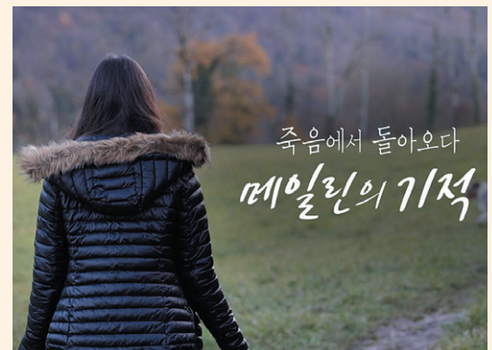
가톨릭평화방송이 방영한 특집 다큐멘터리 ‘죽음에서 돌아오다, 메일린의 기적’.

박 이사장은 “안락사 권유를 뿌리치고 끝내 기적을 일궈낸 데에는 자신이 입양인이었기에 자식을 절대 놓지 않으려는 모친의 의지와 신심이 작용했을 것”이라며 “기회가 된다면 모친의 응어리도 풀 수 있도록 친가족 찾기를 돕고 싶다”고 밝혔다. ▶