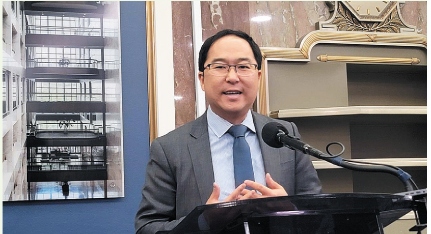
앤디 김 의원이 7일(현지시간) 워싱턴DC 연방의회 의원회관에서 열린 한국을 포함한 아태 지역 국가 언론과 가진 인터뷰에서 발언하고 있다.

이르는 미주 한인 이민사에 중요한 이정표를 세운 일로 평가된다. 김 의원은 상무·과학·교통위원회를 비롯해 은행·주택·도시 문제 위원회, 보건·교육·노동·연금위원회, 국토안보·정부사무위원회 등 총 4개 상임위원회에 배정돼 활동한다.