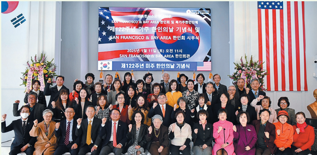
지난 11일(현지시각) 미국 샌프란시스코 총영사관과 샌프란시스코 베이 에어리어 한인회, 북가주 한인단체가 공동으로 주최한 제122주년 미주 한인의 날 기념식 및 2025년 한인회 사무식이 샌프란시스코 베이 에어리어 한인회관에서 열렸다.

1903년 한인 이민자들이 미국에 처음 도착한 1월 13일을 '미주 한인의 날'로 지정하는 결의안이 119대 미국 의회에서 초당적으로 발의됐다.