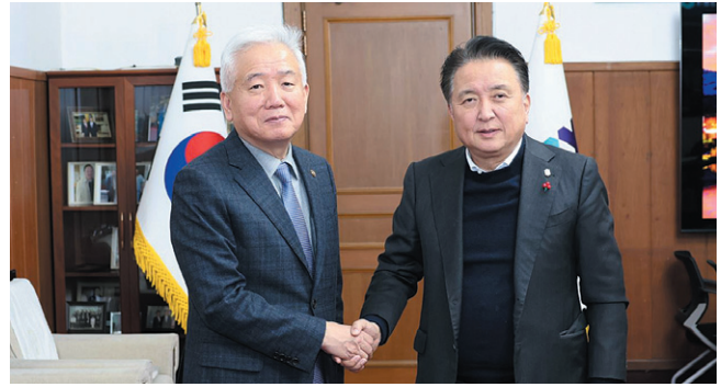
포즈를 취한 이상덕(왼쪽) 재외동포청장과 김영환 충북도지사

동포 지원에 대한 국민적 공감대를 형성하고, 동포 맞춤형 교육 프로그램을 운영하며 국내 동포의 정주·정착을 위한 인프라를 구축해 나갈 예정이다.