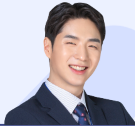
박비즈 대리 마케팅팀

행사 관련된 후기 내용을 간략하게 기재해 주세요. 폰트는 프리텐다드 레귤러 15pt 입 니다. 관련내용을 기재해주세요.